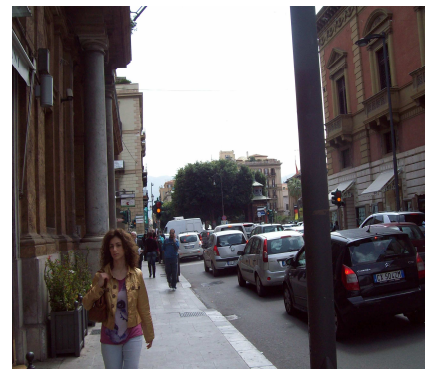
La zona dove sorgeva Porta Maqueda

Questa è proprio la porta attraverso la quale l'immaginazione di Tomasi di Lampedusa fa entrare in città, in una sera di maggio del 1860, il principe Fabrizio Salina accompagnato da Padre Pirrone nel romanzo "Il Gattopardo".