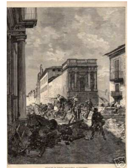
Assalto a Porta Maqueda 1860