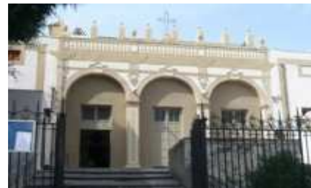
CHIESA SANTA MARIA DI MONSERRATO

SCUOLA PRIMARIA "N.GARZILLI" VIA ISONZO 7 PALERMO